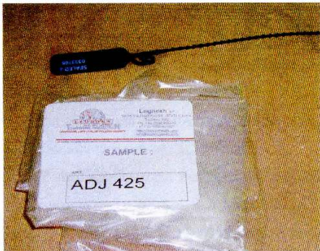
FIGURA 1 - Campione da sottoporre a prova.